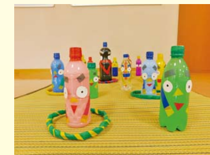
ペットボトルわなげ

同じ廃材から色々なものに生まれ変わることもエコ工作の面白さではないかなと思います。捨ててしまう身近なもので様々なモノを作ったりするイベント等をこの先も開催予定です。詳しくはHPをご覧ください。