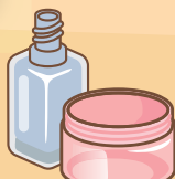
●化粧びん (飲料用のびん類とは成分が異なりますので、「資源物」には出さないでください)